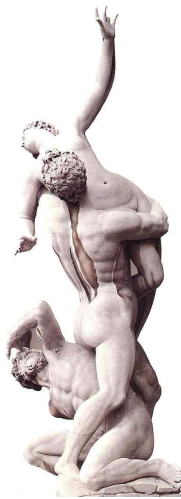
잠볼로냐(Giambologna), 〈사비니 여인의 납치〉, 1583년

미켈란젤로의 〈다비드〉는 콘트라포스토(contrapposto) 자세를 취하여 균형 잡힌 인체의 자연스러운 모습을 보여준다. 이처럼 르네상스는 이상적인 아름다움과 우아함을 추구하여 고대의 부활을 알린다. 반면 잠볼로냐의 〈사비니 여인의 납치〉는 '뱀과 같은 형상'이란 의미의 ( ㉠ ) 자세를 이용하여 뒤틀리는 듯한 움직임을 강조한다. 고요한 상태의 〈다비드〉가 고전 양식에 따라 감상 시점이 정면이라면, 〈사비니 여인의 납치〉는 한 시점에 머무르지 않고 조각상을 돌아가며 관람하도록 이끈다. 과장되고 왜곡된 표현은 ( ㉡ )의 특성으로 당시 종교적·정치적으로 혼란스러웠던 시대적 상황을 반영한 것이다.