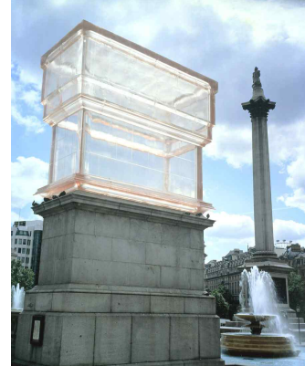
(나) <모뉴먼트>, 2001년, 투명 레진