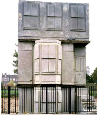
(가) <집>, 1993년, 콘크리트