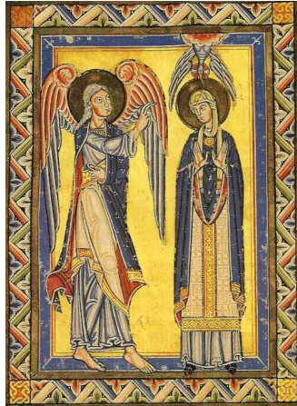
(가) 작자 미상, 1150년경, 필사본