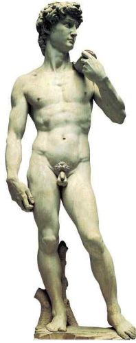
미켈란젤로(Michelangelo), 〈다비드〉, 1504년

5. 다음 작품과 설명을 참고하여 괄호 안의 ㉠에 해당하는 용어와 ㉡에 해당하는 미술 사조를 순서대로 쓰시오.[2점]