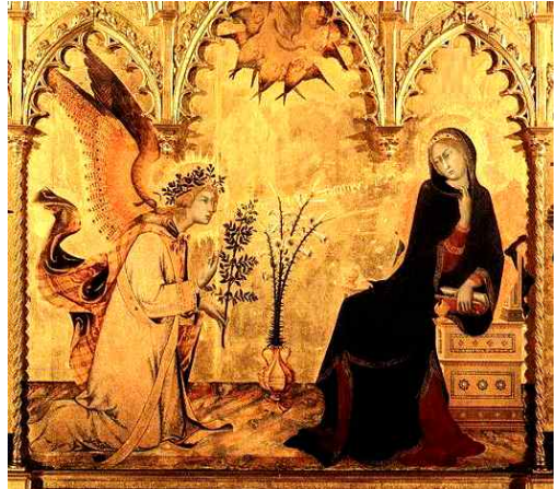
(나) 시모네 마르티니(Simone Martini), 1333년, 제단화