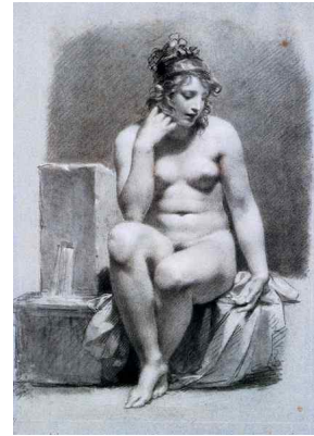
피에르-폴 프뤼동(P. P. Prud'hon), <샘 습작>, 1801년경

( )은/는 '밝음'과 '어둠'을 뜻하는 이탈리아어로 빛과 어둠의 단계적 변화를 통해 대상의 입체감을 표현하는 방법이다. 이것은 르네상스 이후 명암의 대비를 통해 극적 표현 효과를 나타내는 방법을 지칭하는 용어로 쓰인다.